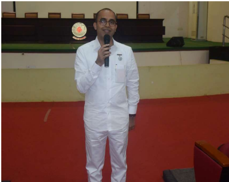
25-11-2019: Guest Lecture for self motivation to students