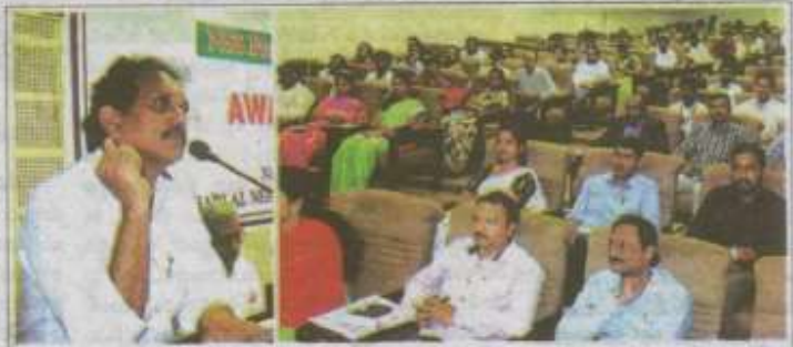
ప్రసంగిస్తున్న ఉప కులపతి, పాతరైత ఎన్ఎస్ఎస్ సీనియర్లు